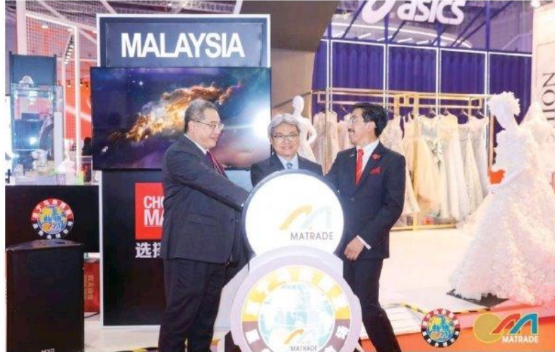
During CIIE 2021, Matrade had arranged over 280 business meetings between the exhibitors and potential buyers from China.